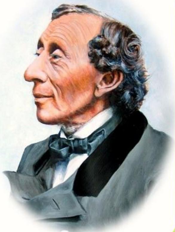
АНДЕРСЕН Ганс Христиан

АНДЕРСЕН ГАНС ХРИСТИАН (1805-1875) - датский писатель-сказочник.